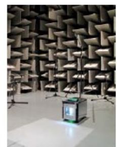
Акустическое испытание ISO 3744